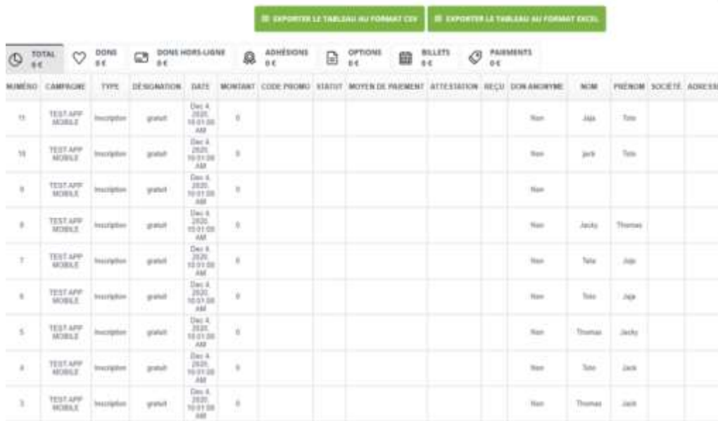
Figure 7 : Suivi des paiements sur la plateforme HelloAsso

NB : Dans un premier temps, seul l'outil HelloAsso permettra d'effectuer des remboursements et de verser les fonds sur le compte bancaire du club.